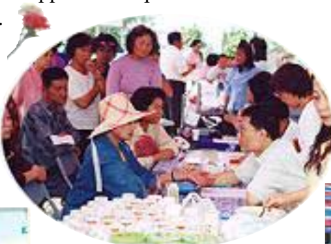
Une longue file d'attente se forme devant les bureaux des médecins pour les consultations gratuites, lesquelles sont spécialement bien accueillies par les résidents de Liuchiu.

L'appui sérieux apporté par le Magistrat Tsai de la municipalité rurale de Liuchiu n'a pas peu contribué au succès de cet événement. Les participants locaux n'avaient pas montré un si grand enthousiasme pour une activité ou une session de vidéo durant les quatre dernières années, a dit Monsieur Tsai, en ajoutant que la Méthode Guan Yin était irrésistiblement attirante. Il nous a dit personnellement au revoir sur le quai avant que nous appareillions pour Formose à la voile, et a clos ainsi une inoubliable journée de Partage de la Vérité.