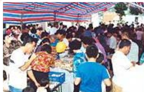
Des foules se rassemblent dans la salle où sont servis les mets végétariens, et même les gourmets sont profondément impressionnés par cette nourriture délicieuse.