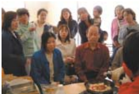
Les invités de Gunma invitent leurs familles et amis au séminaire vidéo et à la démonstration de cuisine végétarienne.