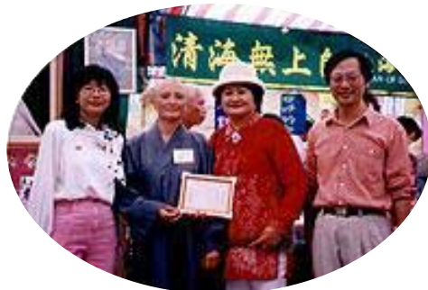
Le parrainage de l'Association bouddhiste Fa-Shing-Pao-Lin présente un certificat de recommandation aux membres de l'Association internationale de Maître Suprême Ching Hai qui ont participé à l'événement.

Le quatrième jour, les amis pratiquants ont dirigé un séminaire sur la Méthode Pratique. Pendant les cinq jours de l'exposition nationale sur la religion, tous les amis pratiquants participant étaient pleins de béatitude divine, parce qu'ils percevaient l'aspiration sincère des gens pour un Maître Illuminé et Son véritable enseignement.