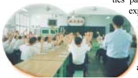
Les amis pratiquants entraînent et encouragent les détenus à chanter et à applaudir.