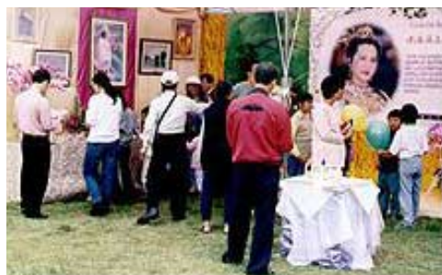
Notre tente d'exposition à l'exposition nationale de religion.

Pendant l'exposition, un courant constant de visiteurs est venu à notre stand. Un invité nous a dit que, en approchant du stand, il a senti une très délicate odeur suave qui l'a apaisé et l'a rafraîchi de l'intérieur, et il a cru que nous avions vaporisé l'endroit avec du parfum. Quelques visiteurs sont restés assis dans notre stand toute la journée, leurs yeux collés à la TV qui passait des vidéos de Maître. Une femme qui prétendait posséder des pouvoirs surnaturels a dit aux amis pratiquants : "Vous ressemblez à des enfants d'êtres humains et d'extraterrestres." Lorsqu'elle demanda comment elle pourrait contacter Maître, un ami pratiquant lui montra un immense poster d'Elle et dit : "Vous pouvez communiquer avec Maître dans votre cœur." Quelques secondes plus tard, les yeux de la femme se remplirent de larmes, et elle dit, "Oh, je l'ai eu !" Profondément émue, elle a quittée la foule pour apprécier sa communion intérieure avec Maître. Quelques amis initiés qui avaient perdu le contact avec Maître après avoir été initiés il y a plusieurs années, ont commencé à pleurer aussitôt qu'ils se sont approchés de la photo de Maître. Ils ressentaient comme si ils étaient des enfants perdus depuis longtemps qui venaient juste de retrouver leur mère, ce fut une scène très touchante.