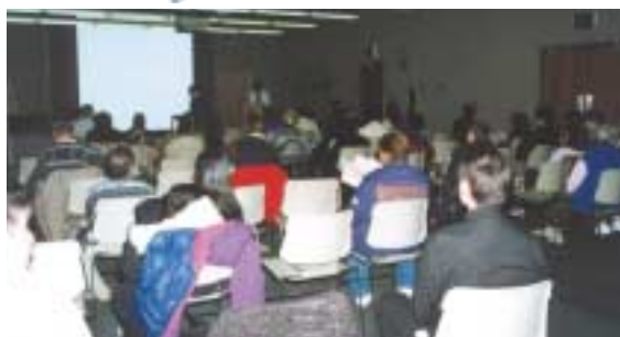
Les initiés de l'Indiana ont organisé trois séminaires vidéo pour propager le message divin aux résidents locaux.