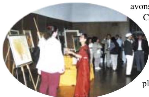
Les initiés du centre de Los Angeles organisent un séminaire vidéo à Cerritos en Californie du Sud, où habite une grande communauté indienne.

avons organisé un séminaire vidéo au Temple Santan Dharma de Cerritos en Californie du Sud, où habite une grande communauté indienne. Les résidents locaux étaient très amicaux et plusieurs connaissaient bien la spiritualité. Les disciples les plus expérimentés ont fait plusieurs choses, telles que la location de la salle, la distribution de dépliants, la préparation de nourriture. Toutes les choses qui se rapportaient à la conférence se sont mises en place avec douceur.