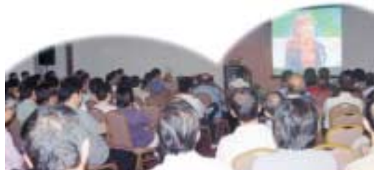
L'auditoire regardant la vidéo de Maître avec une profonde attention.

L'atmosphère de ce lieu s'est instantanément élevée grâce notamment aux lotus en or et aux étoffes dorées décorant ça et là le hall.