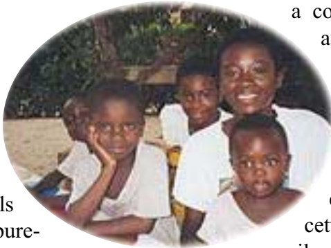
Les petits anges végétariens du centre de Ghana.

C'est alors que Dieu répondit à leur sincérité. Un jour, à la bibliothèque, ils ont lu "La clé de l'illumination immédiate III" et ont été troublés d'y trouver les réponses recherchées depuis si longtemps. Ils ont écrit à notre centre principal, qui leur