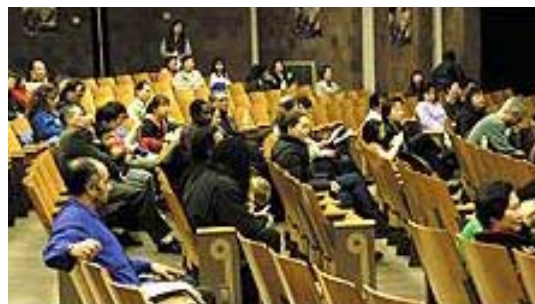
Le séminaire vidéo de New-York apporte le message de Vérité, de vertu et de beauté aux invités ravis.