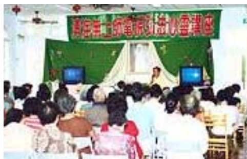
Les habitants de la municipalité rurale de Liu-Chiu participent très sérieusement au séminaire vidéo.