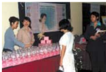
Le buffet végétarien préparé pour les invités.