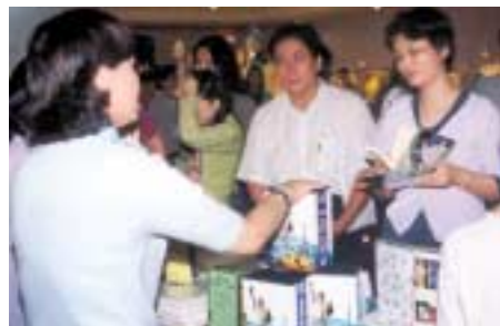
Les invités montrent un grand intérêt pour les publications de Maître.

- visibles ou non - de la ville, alors que les pratiquants s'activaient dans les préparatifs. Le hall du Grand Hôtel, habituellement peu animé et humide, était totalement transformé.