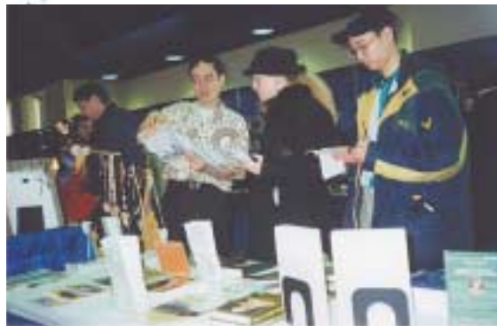
Les initiés de Montréal propagent les enseignements de Maître, et apprennent à être de bons instruments de Dieu.