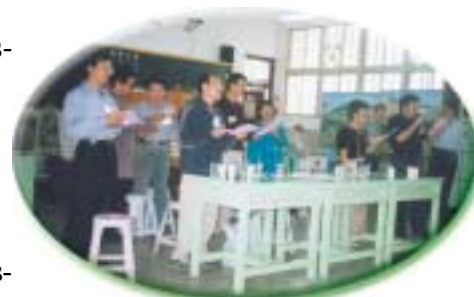
À la prison de Tainan, les amis pratiquants chantent du fond du cœur pour les détenus. Le directeur de la prison (le premier à gauche) se joint à eux.

Le dernier jour, les détenus nous firent un au revoir en marchant en file et en chantant très fort. Lorsque nous les quittâmes, ils nous demandèrent quand nous nous rencontrerions de nouveau. Le directeur de la prison apprécia hautement l'esprit de sincérité, d'amour et de dévotion montré par les pratiquants initiés, tandis que de notre côté nous nous sentions même plus heureux d'avoir dédié notre temps à partager l'amour de Maître avec le monde. Nous sommes très reconnaissants aux détenus d'avoir participé à cet événement, et aussi aux autorités de la prison de Tainan pour nous avoir donné cette opportunité d'apprendre et de progresser ensemble avec les détenus.