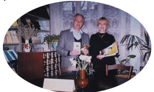
Les professeurs et les libraires de l'Université d'Odessa reçoivent avec joie la brochure de Maître et les magazines, qu'ils souhaitent voir distribuer à leurs étudiants.

Un docteur, qui pratiquait également le Chi-Kong (art martial chinois), a fait l'éloge des enseignements de Maître. À la fois insondables et complets, ces enseignements l'avaient profondément touché. Un autre invité, qui avait auparavant été déçu par une méthode similaire, a trouvé un nouvel espoir spirituel à travers la conférence vidéo de Maître. Il demandait à plusieurs reprises s'il pouvait recevoir une initiation de Maître.