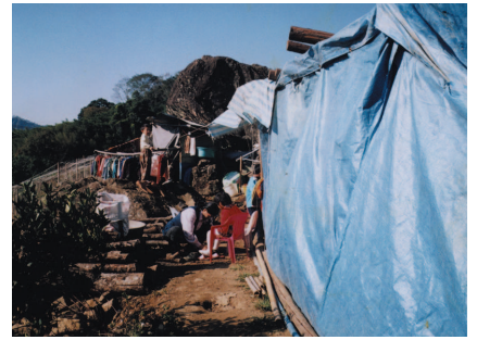
Hier - un abri primitif fait de bâches en toile.

Un reçu de 100 868 NT$ couvrant les frais de construction de la nouvelle maison en métal.