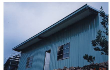
Aujourd'hui - une nouvelle maison en tôles métalliques.