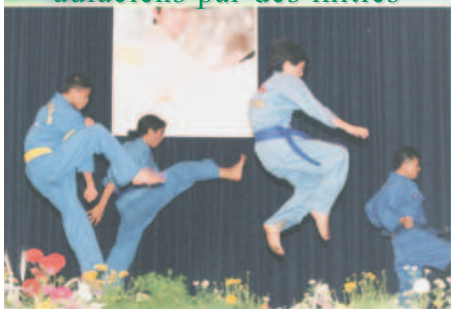
Spectacle d'arts martiaux aulaciens par des initiés