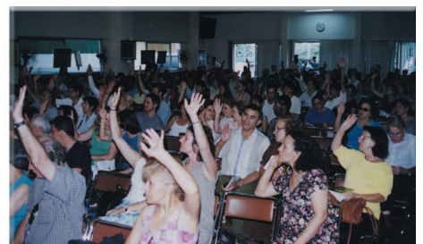
Au séminaire, beaucoup d'invités ont exprimé un grand intérêt pour la pratique spirituelle, et ont levé la main pour demander à apprendre à méditer.

partage de la vérité. Leur développement spirituel mérite vraiment bien plus de réjouissances ! Comme Maître a dit : "C'est si merveilleux d'obtenir l'illumination et la libération à travers la pratique spirituelle, et même encore plus merveilleux d'aider les autres à entreprendre la pratique spirituelle." Tous les amis initiés partagent certainement le même sentiment ! ✿