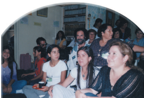
Après l'initiation, le rayonnement de joie s'exprime sur les visages des nouveaux initiés.

Avant la conférence, le centre du Chili a reçu beaucoup de demandes de renseignements par téléphone à propos de cet événement, et même les initiés du pays trouvaient cela inhabituel. Cette réaction a révélé que le concept de pratique spirituelle était devenu incroyablement populaire, au moment où nous entrons dans l'Âge d'Or. Le lieu