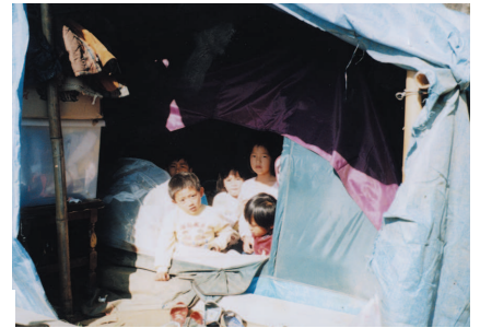
Cette tente abritait six enfants.