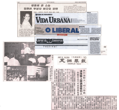
Des journaux chinois et coréens du Brésil publient des nouvelles sur le séminaire vidéo de Maître.

Cette tournée de partage de la Vérité au Brésil a remporté un franc succès. Très impressionnant était l'esprit de nos amis initiés qui, oublieux de la tâche ardue dans laquelle ils étaient impliqués, se sont dévoués de tout leur cœur à leur mission de