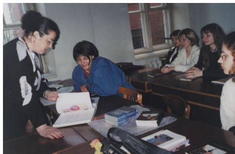
Les professeurs et les étudiants de l'Académie artistique d'Ukraine ont vivement apprécié l'album de créations artistiques de Maître.

Lors d'un dimanche qui suivit la conférence vidéo, la rue principale de Kiev, habituelle-