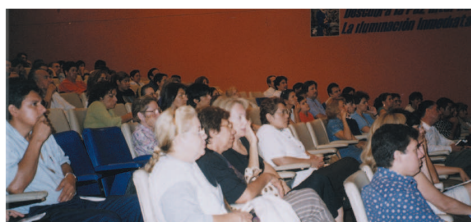
La conférence vidéo au Paraguay

Les deux plus grands journaux d'Asuncion ont rapporté les nouvelles de la conférence. Et, également, plusieurs stations de radio et une célèbre chaîne de télévision ont réalisé des interviews en direct avec nous. Les miracles arrivaient tout simplement les uns après les autres ! Lorsque nous apportons à la station de radio les affiches