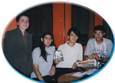
Interview avec une station radio d'Asuncion

[Asuncion] Le Paraguay est un pays situé au nord de l'Argentine, en Amérique du Sud. Après la récente conférence vidéo en Argentine, un messenger Guan Yin et des frères pratiquants d'Argentine et du Chili qui venaient soutenir l'événement, se sont rendus dans la capitale du Paraguay, Asuncion, où ils ont tenu une autre conférence qui a remporté un très grand succès, la plus modeste activité de partage de Vérité dans le quartier Est. En partageant les enseignements de Maître avec les gens, nous espérons que plus d'âmes emplies de désir trouveront le chemin de la Maison.