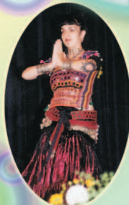
Danse du ventre du Moyen Orient par une initiée