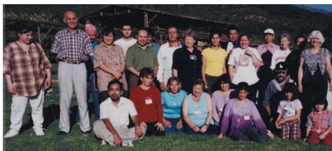
La première retraite en plein air au Chili offre de bons souvenirs pour les initiés du pays.

de rendez-vous était empli d'une foule immense avant que la conférence ne débute. Pour les invités qui arrivaient tardivement et qui n'arrivaient pas à trouver de place dans la salle, une série de télévisions avait été installée en hâte à l'extérieur afin d'offrir une diffusion en direct de la conférence. Les initiés ont été surpris de l'intérêt extrême-