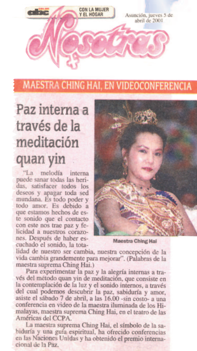
Des journaux paraguayens publient un article sur la conférence vidéo de Maître

C'était notre première conférence de partage de Vérité à Asuncion, et il y avait seulement une sœur initiée dans la région, qui revenait juste du Brésil. Cette sœur sincère avait remué ciel et terre mais n'avait pas réussi à trouver un lieu de rendez-vous convenable. Même l'hébergement pour l'équipe de travail n'était pas valable. Elle a alors prié Maître de tout cœur pour recevoir de l'aide. Peu après, plusieurs miracles ont eu lieu. Premièrement, elle a trouvé un lieu de rendez-vous parfait en ville. Puis, son patron nous a loué un appartement vide à un prix raisonnable, ce qui était bien meilleur marché et plus pratique que d'être dans un hôtel. Notre