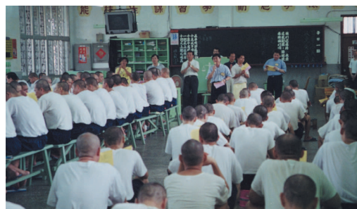
Un séminaire sur l'élévation de l'âme tenu à la prison de Tainan.