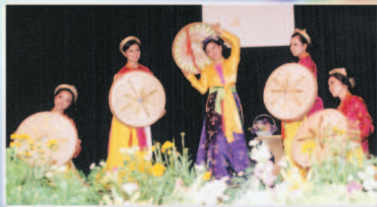
Chanson et danse traditionnelle aulacienne par des initiés